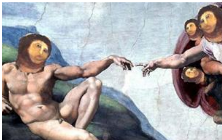
Mashup con detalle de la Capilla Sixtina de Miguel Ángel

contribuir a la reflexión respecto a la manera en que los profesores debemos enfrentar este ambiente que moldea a la sociedad de la información.